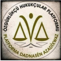
Özgürlükçü Hukukçular Platformu