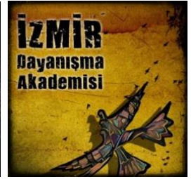
İzmir Dayanışma Akademisi