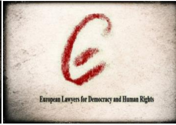
İnsan Hakları ve Demokrasi için Avrupalı Hukukçular Örgütü